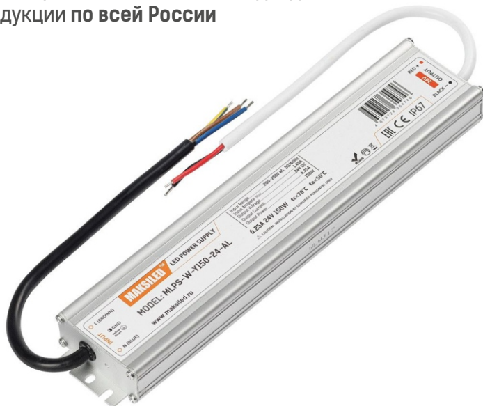
Модель: MLPS-W-Y150-24-AL Размеры: 279*57*25 мм